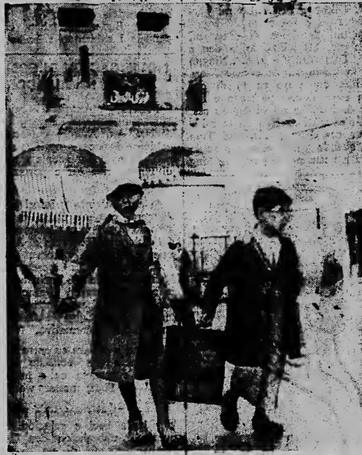
Dos mucha Arabier ta carga un contenido di metal pa awa pa nan hibe cas den un hanchi na Gaza.